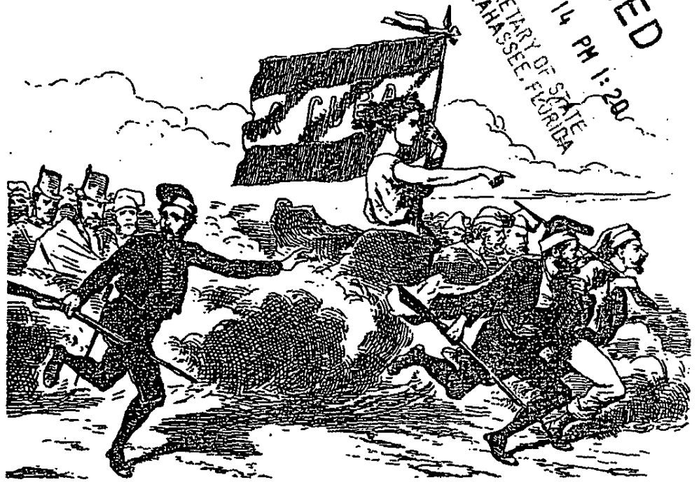
Defensa de intereses. Combatientes catalanes en Cuba.

2012 JUN 14 PM 1:20 FILED SECRETARY OF STATE TALLAHASSEE, FLORIDA