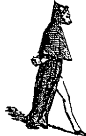
No pagará sin descuento