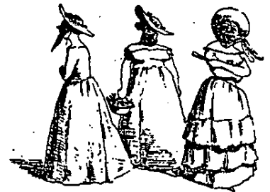
¿Quedo mejor el rebulo de estas posturas?