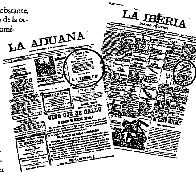
Anuncios en prensa. Narcís Gelats y Cia. promociona sus servicios en periódicos habaneros («La Aduana», agosto de 1894, y «La Iberia», junio de 1889).

Estas firmas, fundadas la mayoría entre finales de la década de los 60 y las postrimerías de los años 70, presentaban, a diferencia de las anteriores sociedades de crédito, muy escaso nivel de socialización del capital debido a su restrictivo carácter de sociedades personalistas. Asimismo, simultaneaban con las operaciones bancarias otras que habían dado lugar a su fun-