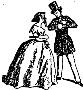
Operaciones á glass sobre una sociedad no constituida legalm te